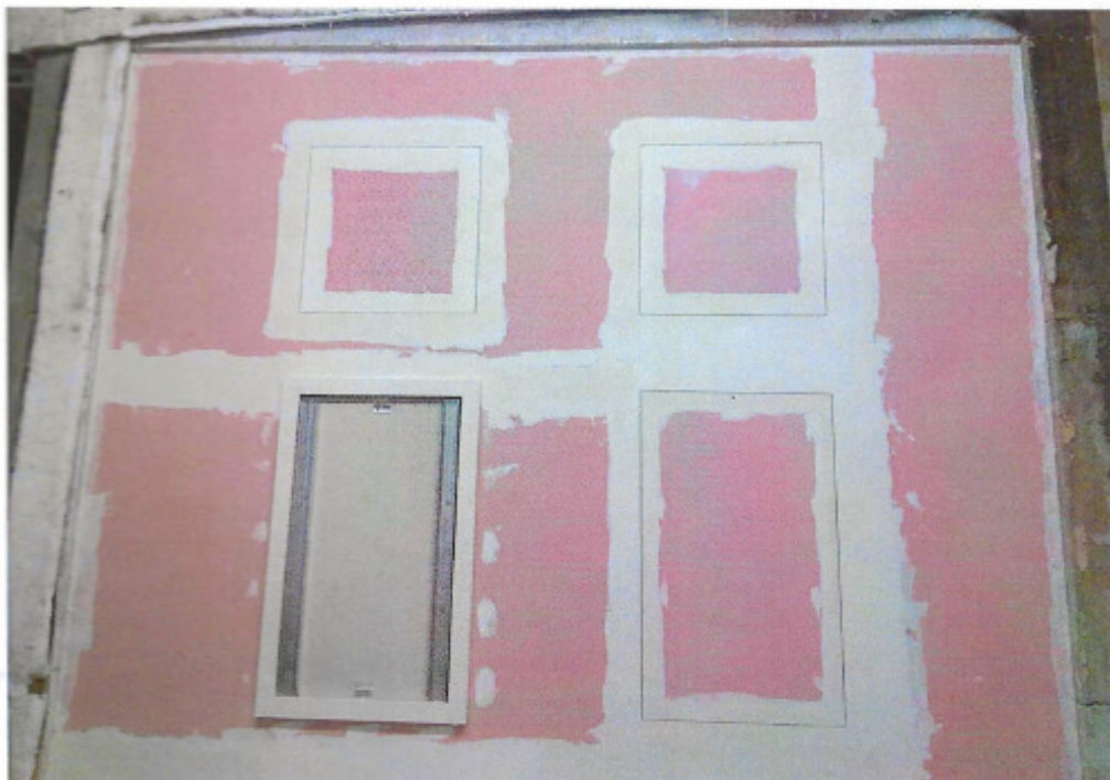
Figura 3. Face exposta da amostra a ensaiar