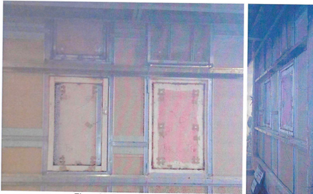
Figura 21. Face não exposta da amostra ensaiada

As figuras 21 e 22 apresentam a amostra, após o ensaio, na sua face não exposta e na face exposta ao fogo.