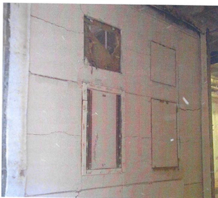
Figura 22. Face exposta da amostra ensaiada