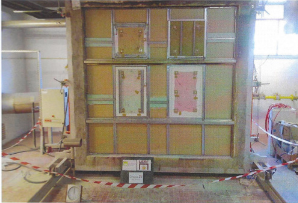
Figura 2. Face não exposta da amostra a ensaiar

As figuras 2 e 3 apresentam a amostra de ensaio antes do início do ensaio.