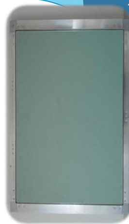
Vista exterior (como suministrada)

Trampilla de registro com marcos en aluminio (603035 con tratamiento T5), reforzada por escuadros en acero galvanizado con 1,20 mm de espesor tipo DX51 D, con tratamiento anticorrosivo Z-200 y placa de yeso impregnada Knauf H1 (EN520) espesor 12,5 (BA13) o 15 (BA15) mm*, fijada por sistema de pegado especial. A partir de 700x700 mm - placa atornillada.